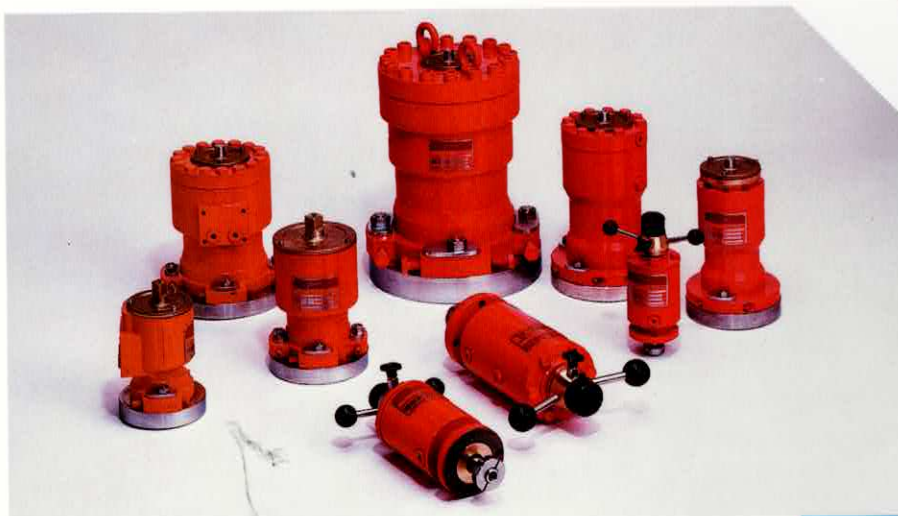
Danfoss hydraulische aandrijvingen/componenten

Het programma omvat elektronische, pneumatische- en hydraulische apparatuur van gerenommeerde merken.